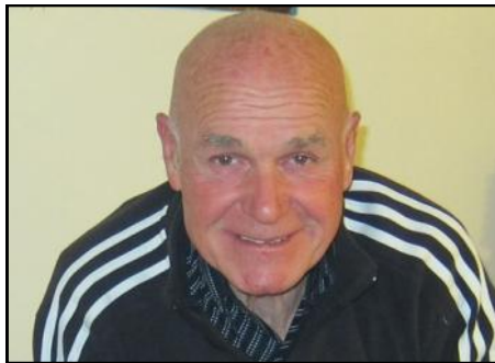
Le nouveau Président des AIL